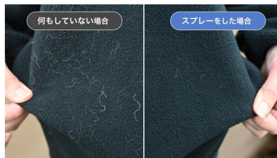
図2. 衣類に「QAIS-clear- for FABRIC」をスプレーした場合と何もしていない場合の毛の付着の比較

布製品や衣類にあらかじめスプレーをすることで、帯電による抜け毛の付着を抑えます(図2)。