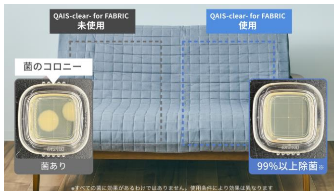
図4. 綿製ソファカバーに「QAIS-clear- for FABRIC」をスプレーした場合と何もしていない場合の菌の状態の比較

菌に接触した時だけ活性化される要時生成型亜塩素酸イオン(MA-T®)を採用することで、ニオイの原因菌を除菌(図4)。頻繁に洗濯が出来ない布製品のケアが気軽にできます。